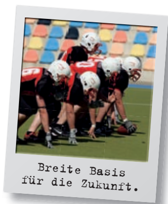
Breite Basis für die Zukunft.

Die Rookies der Mavericks werden dann noch nicht dazu gehören, sie sind eher für das bunte Rahmenprogramm zuständig. „Wir möchten den Finalisten und dem Publikum eine tolle Veranstaltung bieten und hoffen, bei gutem Wetter die Rekordmarke von 2.000 Zuschauern zu knacken“, sagt Fossen.